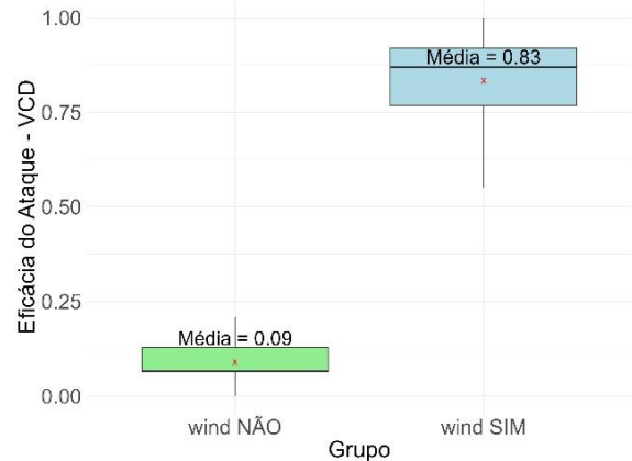
Fig. 3. Comparação de novas simulações com a realização da manobra winding com a sua configuração otimizada.